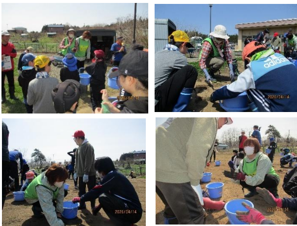
4/14 子どもたちと一緒に石拾い・草取り